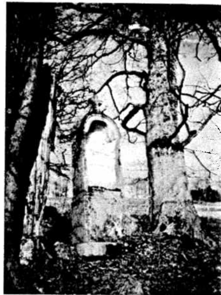
Obnova památek na Šumavě / Repairs of small architectural monuments at Šumava