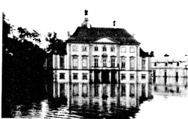
Oprava zámku Liběchov po povodních / Repairs of the Liběchov castle after floods